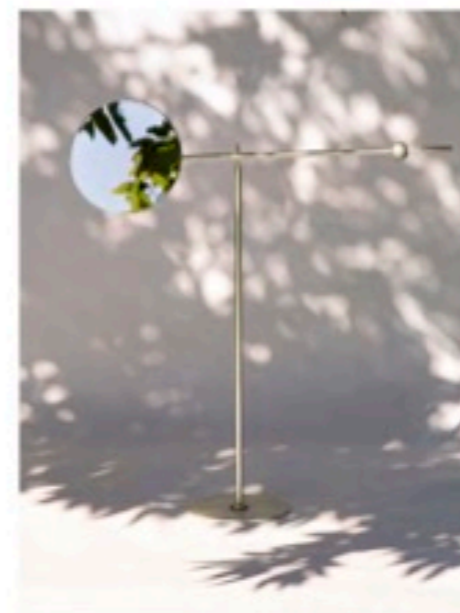
Statara Mirror. Elias Van Orshaegen. ©Rikki Siebens. Sinople