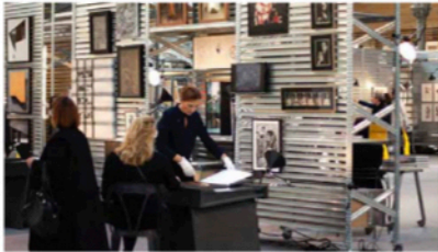
Le salon Galeristes.